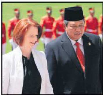
Susilo Bambang Yudhoyono. Οι δύο ηγέτες συζήτησαν διμερή θέματα, ενώ η κα Γκίλαρντ

Η κα Γκίλαρντ, η οποία βρίσκεται στο Μπαλί όπου συμμετέχει στην Ασιατική σύνοδο κορυφής, συναντήθηκε την Κυριακή με τον πρόεδρο της Ινδονησίας