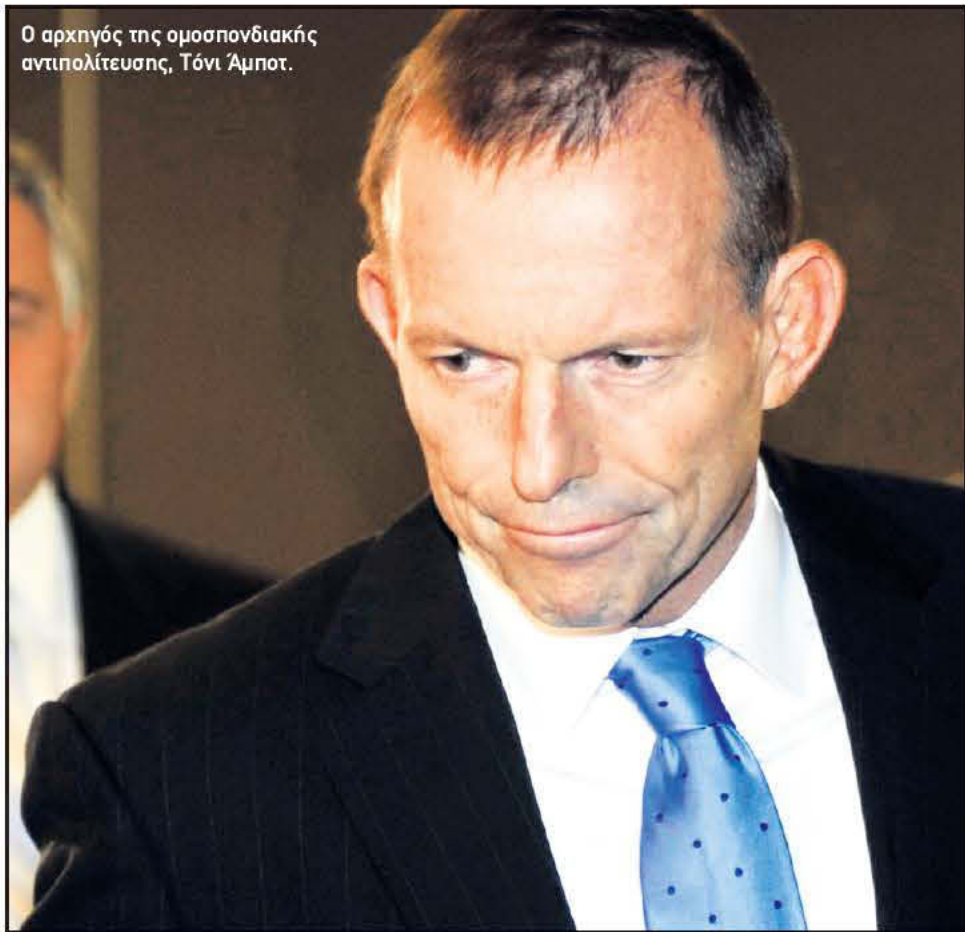
Ο αρχηγός της ομοσπονδιακής αντιπολίτευσης, Τόνι Άμποτ.

τικοί παρατηρητές, θα την εξασφαλίσει. Να σημειωθεί ότι χθες ανακοίνωσε ότι θα υποστηρίξει το νομοσχέδιο και ο ανεξάρτητος βουλευτής, Τόνι Γουίνδσορ. Αν το νομοσχέδιο περάσει από Βουλή και Γερουσία, τότε θα επιβληθεί φόρος 30% στα υπερκέρδη των ορυχείων.