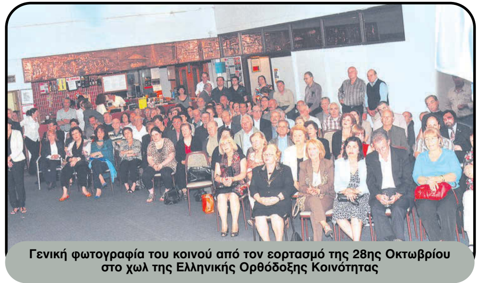
Γενική φωτογραφία του κοινού από τον εορτασμό της 28ης Οκτωβρίου στο χωλ της Ελληνικής Ορθόδοξης Κοινότητας