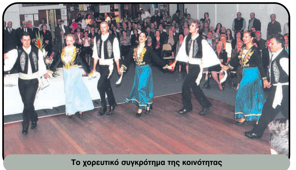
Το χορευτικό συγκρότημα της κοινότητας

Αποκλειστικές φωτογραφίες του Γιώργου Παναγόπουλου, 0410 552 995