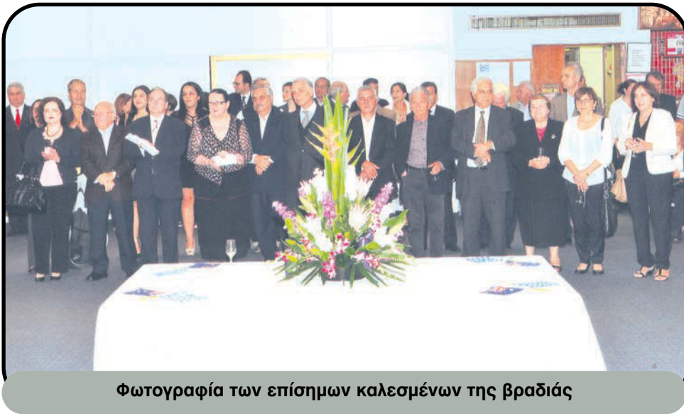
Φωτογραφία των επίσημων καλεσμένων της βραδιάς