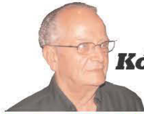
Επιμέλεια ΓΙΩΡΓΟΥ ΧΑΤΖΗΒΑΣΙΛΗ

"Η Ελλάς εδημιούργησε το παράδειγμα, το οποίον ο καθείς από ημάς οφείλει να ακολουθήσει μέχρις ότου οι άρπαγες της ελευθερίας αχθούν τελικώς εις την δικαίαν εξόντωσίν των." - Πρόεδρος Franklin Roosevelt