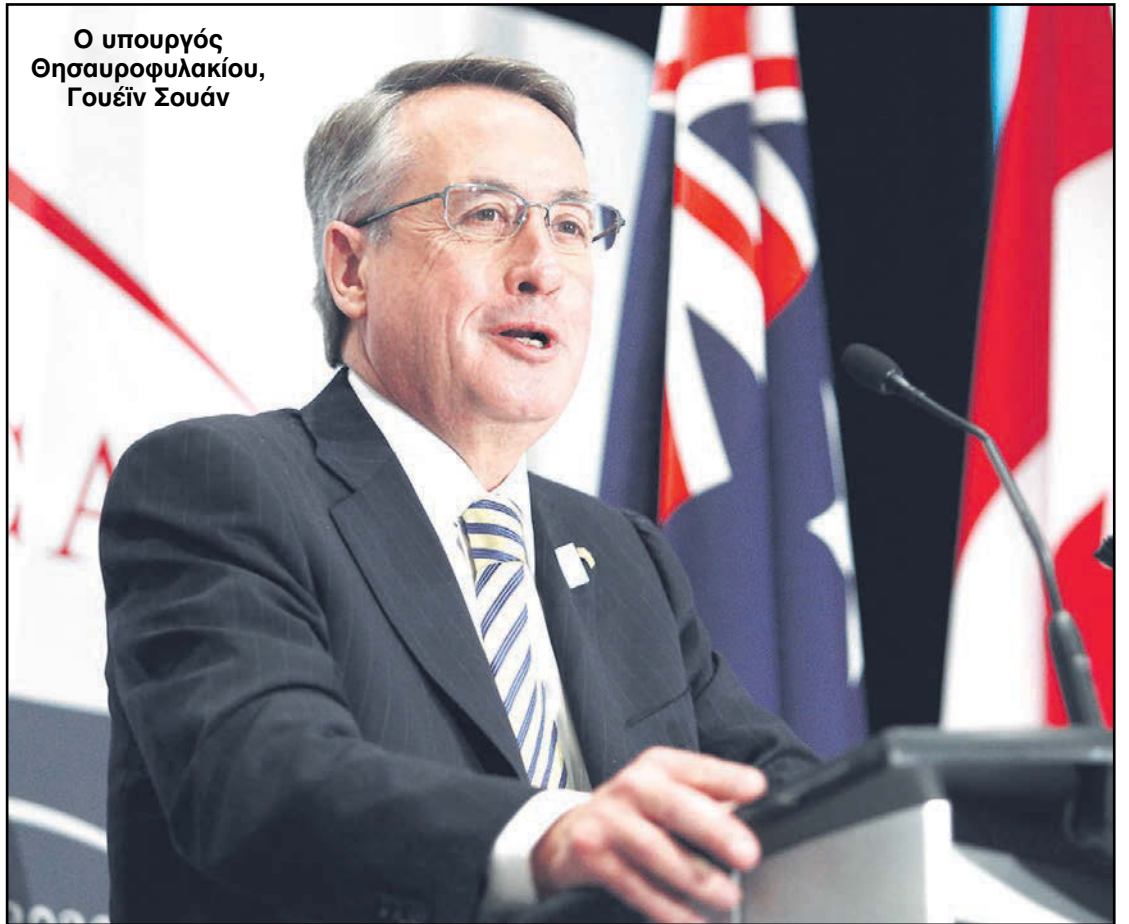
Ο υπουργός Θησαυροφυλακίου, Γουέϊν Σουάν

Και οι τρεις συλληφθέντες προφυλακίστηκαν ενώ αναμενόταν χθες να προσαχθούν στο Δικαστήριο του Γκόσφορντ με πολλές κατηγορίες εναντίον τους για καλλιέργεια κάνναβης και κλοπή ηλεκτρικού ρεύματος.