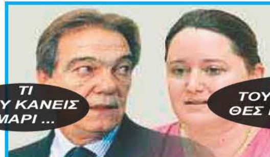
ΤΙ ΜΟΥ ΚΑΝΕΙΣ ΜΑΡΙ ...

ΑΘΗΝΑΙΟΣ σχολιαστής του θέματος γράφει τα εξής: Καιρός είναι, αφού ο Νίκος Σηφουνάκης, δεν έχει... τσίπα (άλλη λέξη ήθελα να πω, αλλά ας όμειται ο... πολιτισμός μου) και δεν την κάνει από το αξίωμά του,