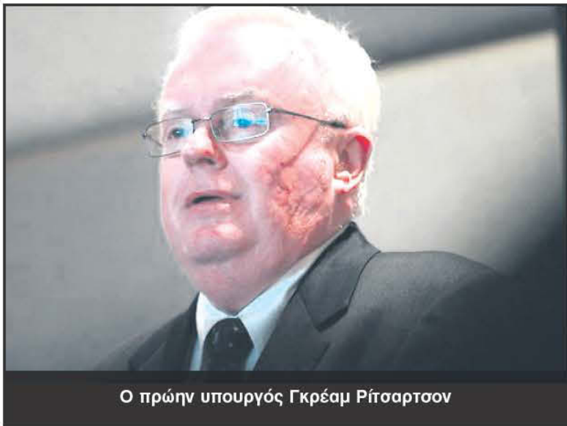
Ο πρώην υπουργός Γκρέαμ Ρίτσαρτσον