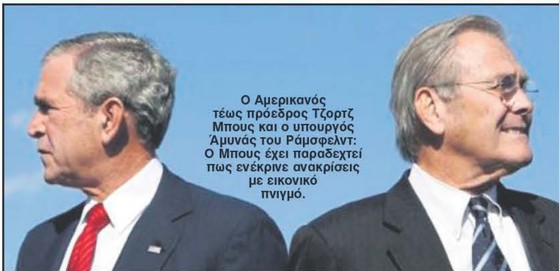
Ο Αμερικανός τέως πρόεδρος Τζορτζ Μπους και ο υπουργός Άμυνας του Ράμσφελντ: Ο Μπους έχει παραδεχτεί πως ενέκρινε ανακρίσεις με εικονικό πνιγμό.