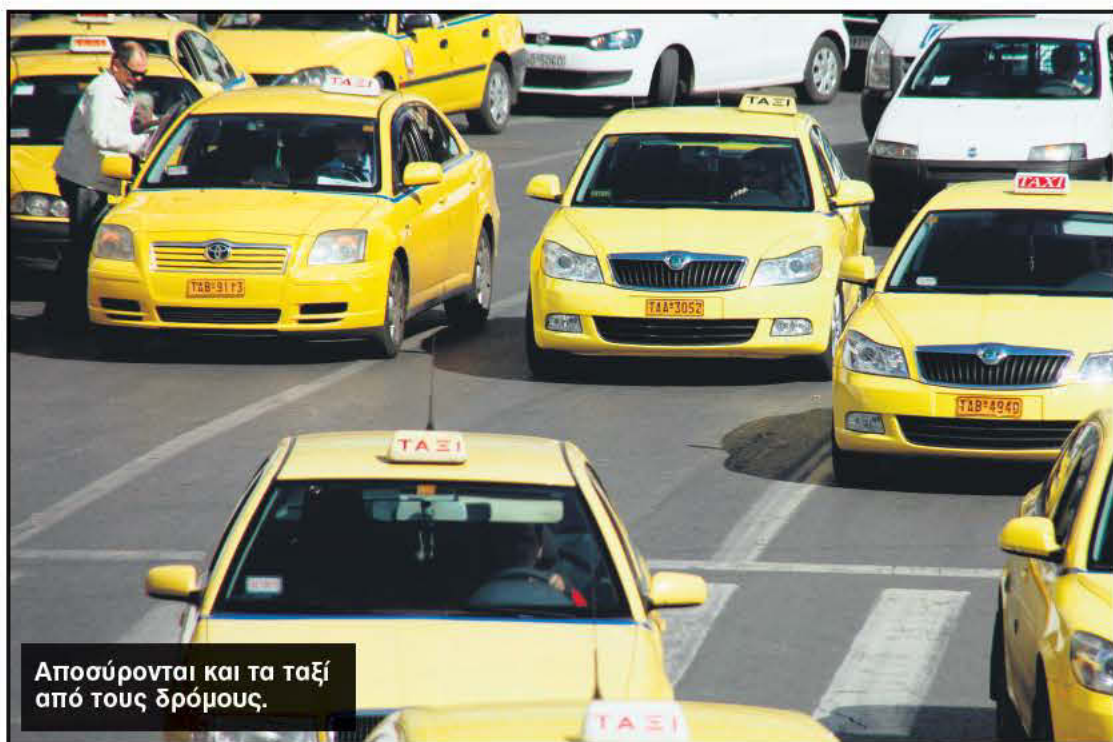
Αποσύρονται και τα ταξί από τους δρόμους.