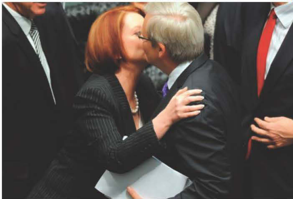
ΑΥΤΟΣ ΤΗ ΦΙΛΗΣΕ ΣΤΟ ΜΑΓΟΥΛΟ, ΑΥΤΗ ΠΗΓΕ ΝΑ ΤΟΥ ΤΟ ΔΩΣΕΙ ΣΤΟ ΣΤΟΜΑ ΤΟ ΦΙΛΙ (ΟΠΩΣ ΣΤΟ ΠΑΡΕΛΘΟΝ ΤΟ ΔΗΛΗΤΗΡΙΟ) ΑΛΛΑ - ΣΥΜΦΩΝΑ Μ' ΑΥΤΟΠΤΕΣ ΜΑΡΤΥΡΕΣ - ΔΕΝ ΤΑ ΚΑΤΑΦΕΡΕ!

Οι ψυχρές θερμοκρασίες της Βόρειας Ευρώπης αντισταθμίζονται από τις θερμότερες που προέρχονται από τον νότο, ως εκ τούτου δεν υπάρχει καμία καθαρή μεταβολή της θερμοκρασίας της Γης, κατά μέσο όρο κατά τη διάρκεια ενός έτους.