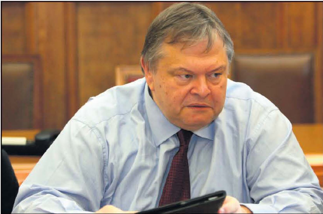
ΕΠΙΣΤΡΟΦΗ ΣΤΟ ΒΙΟΤΙΚΟ ΕΠΙΠΕΔΟ ΤΟΥ 2004 ΜΕ ΜΕΤΡΑ ΛΙΤΟΤΗΤΑΣ 6 ΔΙΣ.