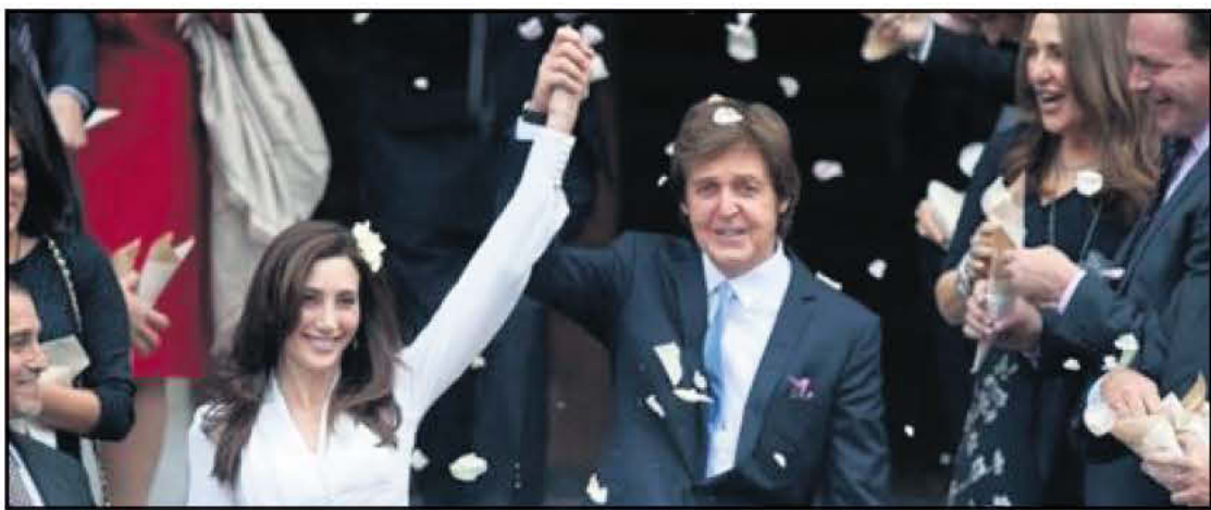
ΣΤΟ ΛΟΝΔΙΝΟ Ο ΤΡΙΤΟΣ ΓΑΜΟΣ ΓΙΑ ΤΟ "ΣΚΑΘΑΡΙ"