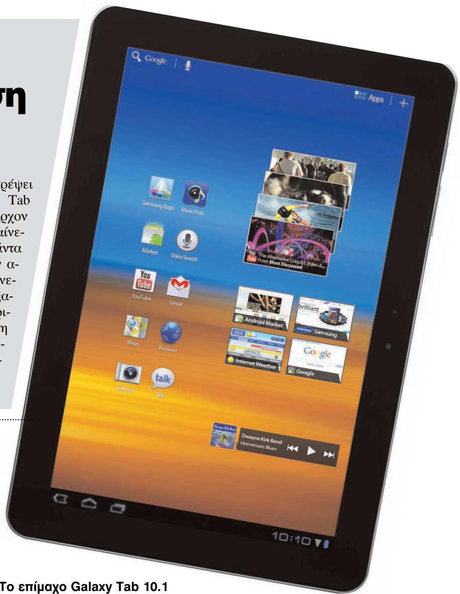
Το επίμαχο Galaxy Tab 10.1

γοντας ότι επιθυμεί να αποτρέψει την κυκλοφορία του Galaxy Tab 10.1 και να διατηρήσει το υπάρχον status quo στην Αυστραλία. Φαίνεται ότι η Apple θα κάνει τα πάντα προκειμένου να κρατήσει τον ανταγωνισμό όσο πιο μακριά γίνεται. Η εταιρεία έχει ήδη εξασφαλίσει προσωρινά περιοριστικά μέτρα στην Αυστραλία, τη Γερμανία και την Ολλανδία, ενώ επίκειται και η κρίσιμη απόφαση της αμερικανικής δικαιοσύνης.