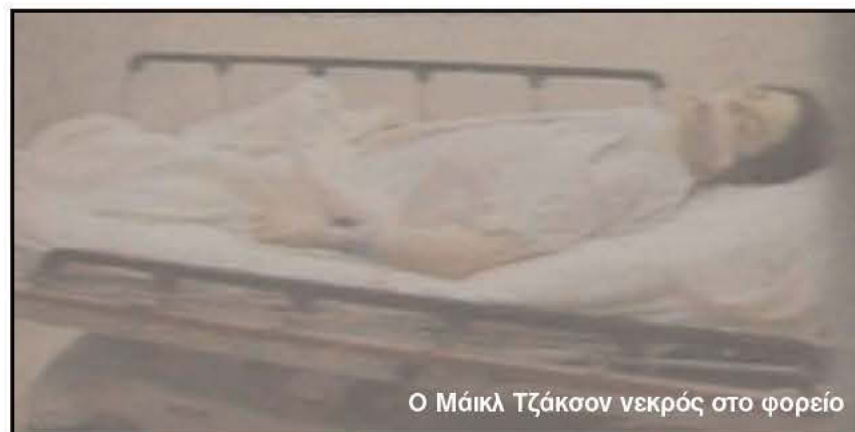
Ο Μάικλ Τζάκσον νεκρός στο φορείο