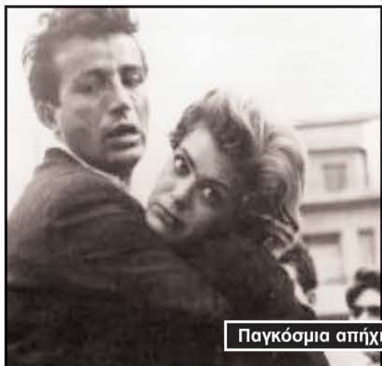
Παγκόσμια απήχηση είχε η "Στέλλα".

Για περισσότερες πληροφορίες επισκεφθείτε www.greekfilmfestival.com.au