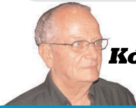
Επιμέλεια ΓΙΩΡΓΟΥ ΧΑΤΖΗΒΑΣΙΛΗ

Omne ignotum pro magnifico. Κάθε τι το άγνωστο, λαμπρό. Χαρακτηρίζει την έλξη του ανθρώπου για το άγνωστο.