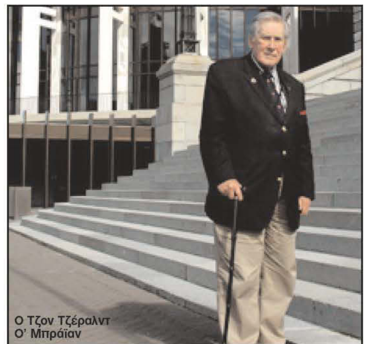
Ο Τζον Τζέραλντ Ο' Μπράϊαν

Πρωτοστάτησε, μάλιστα, στο να υιοθετήσει η Βουλή της Νέ-