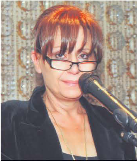
Η πρόεδρος του ΟΕΕΓΑ, Βίκη Μαρ-Συρίου