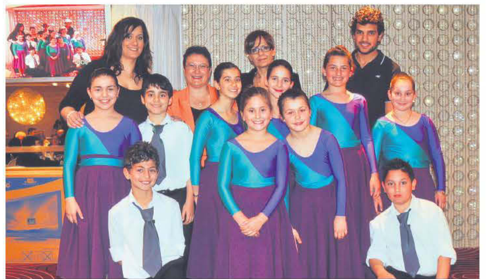
Τα παιδιά που χόρεψαν στην εκδήλωση