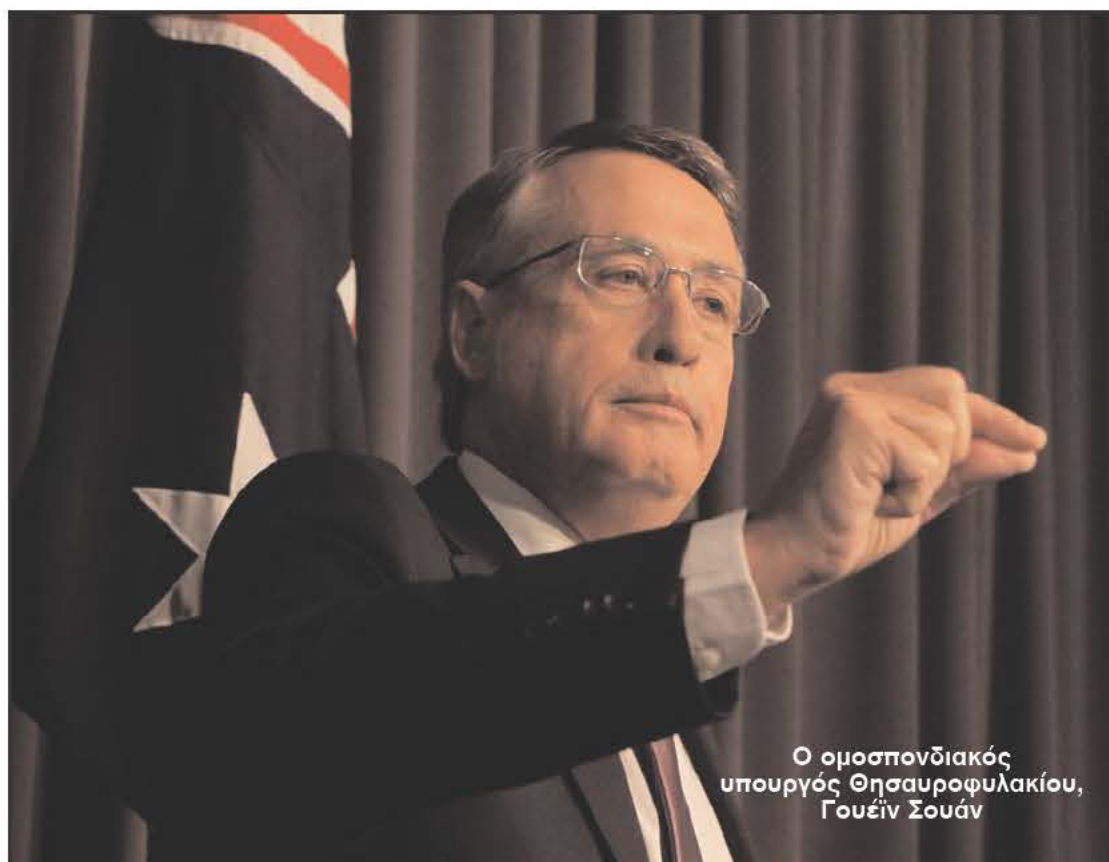
Ο ομοσπονδιακός υπουργός Θησαυροφυλακίου, Γουέιν Σουάν