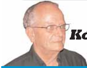
Επιμέλεια ΓΙΩΡΓΟΥ ΧΑΤΖΗΒΑΣΙΛΗ

Τίποτα δεν είναι αδύνατο όταν βάζεις τους άλλους να το κάνουν για σένα!