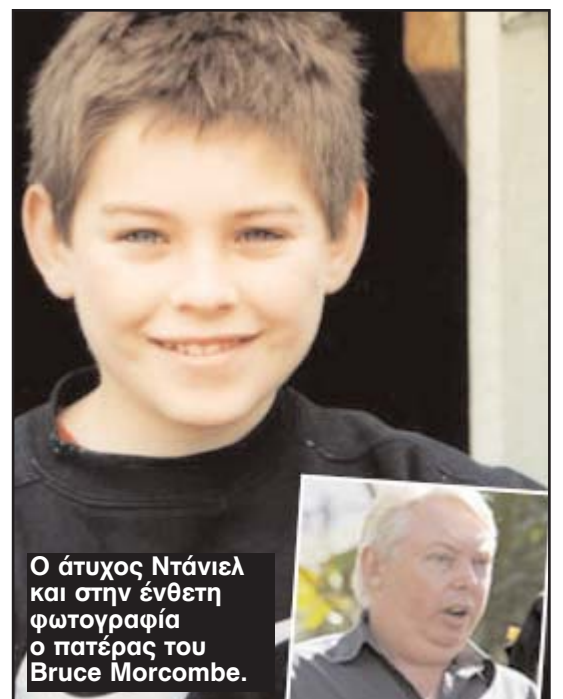
Ο άτυχος Ντάνιελ και στην ένθετη φωτογραφία ο πατέρας του Bruce Morcombe.

Όπως είναι γνωστό, για την απαγωγή και δολοφονία του, συνελήφθη ένας άντρας ηλικίας 41 χρόνων από το Περθ.