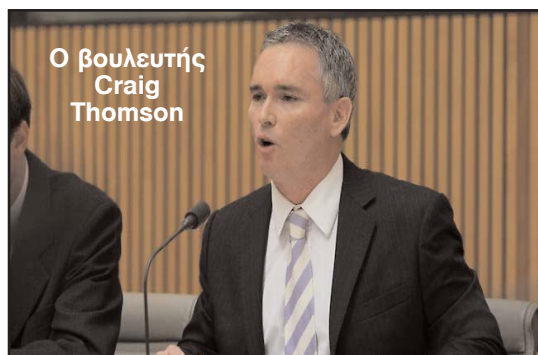
Ο βουλευτής Craig Thomson

Ο πρώην Γραμματέας του Συνδικάτου Υγειονομικών Υπηρεσιών, δέχεται τα πυρά της αντιπολίτευσης που ζητά την παραίτησή του, μετά την αποκάλυψη ότι η υπηρεσιακή πιστωτική του κάρτα χρησιμοποιήθηκε για να πληρωθούν γυναίκες ελευθερίων ηθών. Σύμφωνα με τις εφημερίδες του εκδοτικού συγκροτήματος Φαίρφαξ, ο ίδιος ο κ. Τόμσον είχε τηλεφωνήσει από δωμάτιο ξενοδοχείου, το 2006, σε τρεις οικους ανοχής.