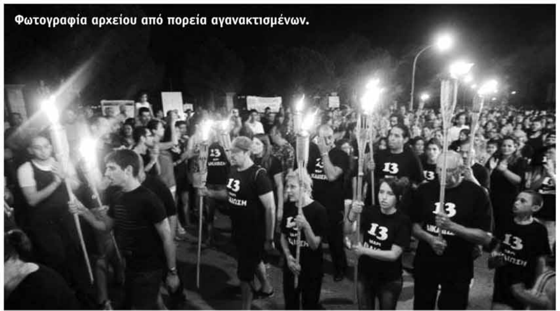
Φωτογραφία αρχείου από πορεία αγανακτισμένων.