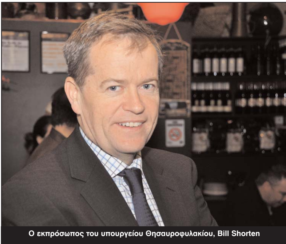
Ο εκπρόσωπος του υπουργείου Θησαυροφυλακίου, Bill Shorten

ρυξης μετάλλων και τον φόρο ρύπανσης, η κυβέρνηση Γκίλαρντ έχει στραμμένο το βλέμμα της στην υλοποίηση της υπόσχεσης για πλεονασματικό προϋπολογισμό.