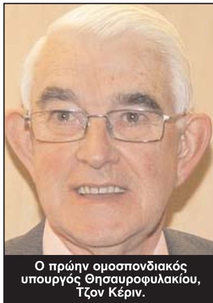
Ο πρώην ομοσπονδιακός υπουργός Θησαυροφυλακίου, Τζον Κέριν.

Να σημειωθεί ότι από το 2002 μέχρι σήμερα ο αριθμός των μελών του Εργατικού κόμματος μειώθηκε κατά περισσότερα από 10.000 άτομα.