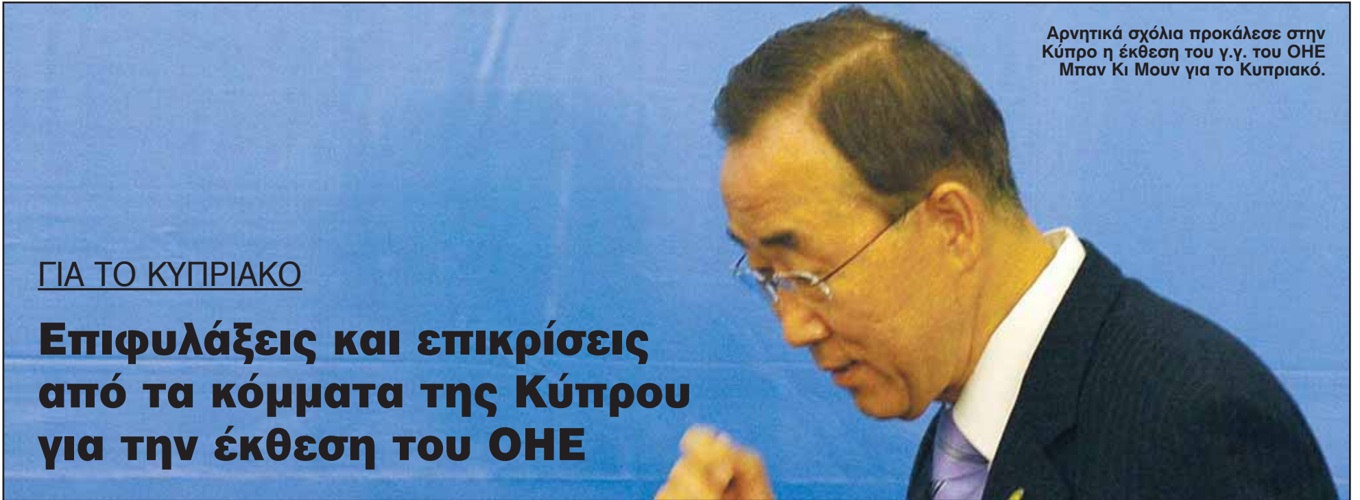
Αρνητικά σχόλια προκάλεσε στην Κύπρο η έκθεση του γ.γ. του ΟΗΕ Μπαν Κι Μουν για το Κυπριακό.