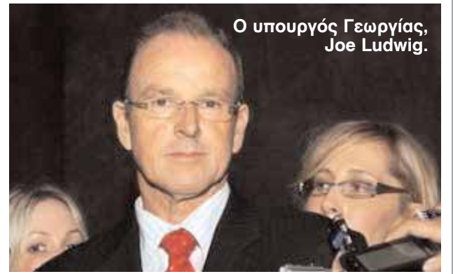
Ο υπουργός Γεωργίας, Joe Ludwig.

θεια προς τους κτηνοτρόφους που επηρεάστηκαν από το εμπόργκο στις εξαγωγές ζωντανών βοοειδών στην Ινδονησία. Όμως, ο εκπρόσωπος του υπουργού Γεωργίας, Joe Ludwig, διέψευσε κατηγορηματικά τις πληροφορίες, υποστηρίζοντας ότι δεν εξετάζεται το ενδεχόμενο να διατεθούν στους κτηνοτρόφους περισσότερα από τα $30 εκ. που ανακοινώθηκαν τον Ιούνιο. Η ομοσπονδιακή κυβέρνηση προχώρησε στην άρση του εμπόργκο στις εξαγωγές ζωντανών βοοειδών στην Ινδονησία, μετά τις επιβεβαιώσεις που δόθηκαν από την ασιατική χώρα ότι