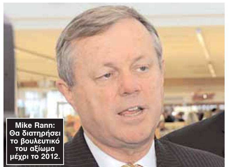
Mike Rann: Θα διατηρήσει το βουλευτικό του αξίωμα μέχρι το 2012.

Ο πρωθυπουργός της Νότιας Αυστραλίας, Mike Rann, ξεκαθάρισε ότι όταν παραιτηθεί από την αρχηγία του Εργατικού Κόμματος, θα διατηρήσει το βουλευτικό του αξίωμα μέχρι το 2012, για να αποφευχθεί η διεξαγωγή συμπληρωματικών εκλογών στην έδρα του την περίοδο των Χριστουγέννων και της Πρωτοχρονιάς. Ο κ. Rann, ο οποίος όπως είναι γνωστό ανακοίνωσε ότι θα παραιτηθεί από την αρχηγία στις 20 Οκτωβρίου, ξεκαθάρισε την Τρίτη ότι δεν είναι στις προθέσεις του να παραιτηθεί και από το βουλευτικό του αξίωμα, για να μην υποχρεώσει τους ψηφοφόρους να κατέβουν στις κάλπες μέσα στις γιορτές. «Θα παραμείνω στη Βουλή λίγους μήνες μετά την παραίτησή μου από την αρχηγία του Εργατικού Κόμματος. Θα ήταν άδικο να υποχρεώσω τους ψηφοφόρους του Salisbury, να κατέβουν