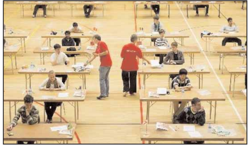
Φωτογραφία από τη Διεθνή Μαθηματική Ολυμπιάδα, που διεξήχθη στο Άμστερνταμ στις 19 Ιουλίου