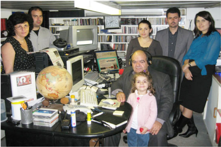
Δημοσιογράφοι που έχετε θαυμάσει στην τηλεόραση, αλλιά και αλλιοι που βρίσκονται μόνο στο ραδιόφωνο, παρελαύνουν από το σταθμό μας, με τις εκπομπές τους, φέρνοντας κοντά μας την Ελλάδα

ΣΥΝΤΟΝΙΣΤΕΙΤΕ με τον ραδιοφωνικό σταθμό ΡΑΔΙΟ - ΓΕΦΥΡΑ στη συχνότητα των 152.325 χιλιοκυκλών. Επικοινωνούμε μαζί σας, με φαντασία συναίσθημα, ποιότητα, γνώση και λογική. Ο σταθμός μας έχει καταστεί ένα ενημερωτικό και ψυχαγωγικό βήμα που διακρίνεται από συνέπεια, αξιοπιστία, πληρότητα, υπευθυνότητα και σύνεση. "ΡΑΔΙΟ - ΓΕΦΥΡΑ" ΓΕΦΥΡΑ με την πατρίδα και όλο τον κόσμο. ΓΕΦΥΡΑ με την παράδοση, τα ήθη και τα έθιμα. ΓΕΦΥΡΑ με την ιστορία, παλαιά και σύγχρονη. ΓΕΦΥΡΑ με το παρελθόν το παρόν και το μέλλον. ΓΕΦΥΡΑ με τις ανθρώπινες σχέσεις. "ΡΑΔΙΟ - ΓΕΦΥΡΑ" 24 ώρες το εικοσιτετράωρο, με πολύ καλή προγράμματα ντόπια παραγωγή, αλλιά και από την πατρίδα και όλο τον κόσμο.