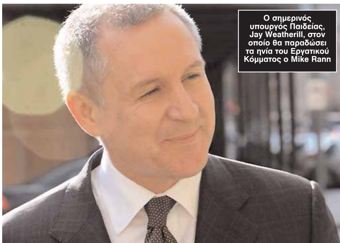
Ο σημερινός υπουργός Παιδείας, Jay Weatherill, στον οποίο θα παραδώσει τα ηνία του Εργατικού Κόμματος ο Mike Rann

Το σεξουαλικό εκείνο σκάνδαλο ήταν το πιο πρόσφατο από μια σειρά σκανδάλων που έχει δημιουργηθεί με πρωταγωνιστές στρατιωτικούς στην ακαδημία.