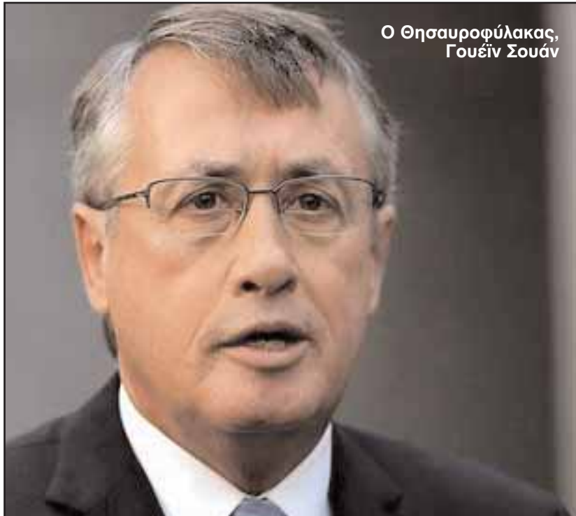
Ο Οθησαυροφύλακας, Γουέιν Σουάν

Οικονομολόγοι προειδοποιούν ότι η άνοδος του κόστους ζωής στην Αυστραλία - που ήταν μεγαλύτερη του αναμενόμενου κατά το τρίμηνο Μαρτίου - Ιουνίου του τρέχοντος έτους - ενισχύει το ενδεχόμενο νέας ανόδου των επιτοκίων. Το κόστος ζωής κατά το τελευταίο τρίμηνο ανήλθε στο 0,9% και ο πληθωρισμός, σε ετήσια βάση, ανήλθε στο 3,6%, που είναι και το υψηλότερο ποσοστό του από το 2008.