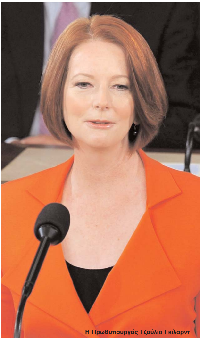
Η Πρωθυπουργός Τζούλια Γκίλαρντ

χεία που έδωσε στη δημοσιότητα ο οργανισμός Pharmacy Guild, τα οποία υποστηρίζουν ότι μόνο το κόστος κατανάλωσης ηλεκτρικού ρεύματος των φαρμακείων θα αυξηθεί κατά περισσότερα από $2,000 τον χρόνο. Ο Αρχηγός του Συνασπισμού επισκέφθηκε την Κυριακή ένα φαρμακείο στο Cherrybrook, βορειοδυτικά του Σίδνεϊ, απ' όπου και έκανε τις πιο πάνω δηλώσεις.