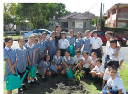
Year 4 plants trees for the future care of our Planet