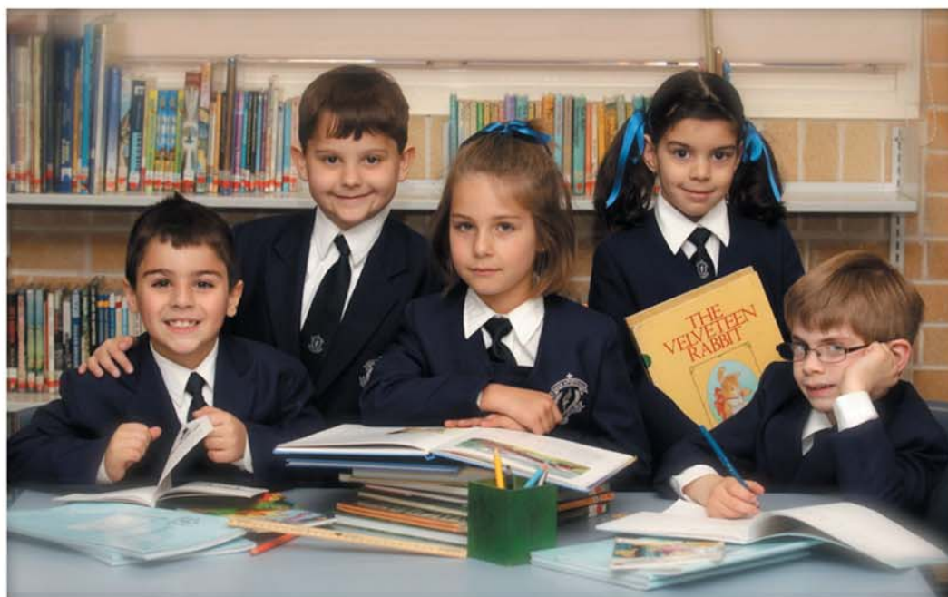
Today's Students - Tomorrow's Leaders