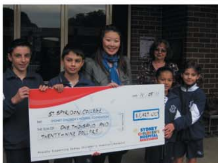
Community Action to help with Leukaemia Research