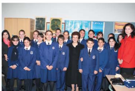
The First Lady of Cyprus - Mrs Christofia visits our school