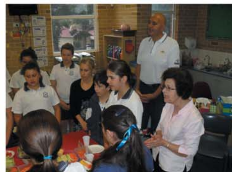
Year 6 olive tasting - honouring our traditions

Educational Excellence within a Caring Environment