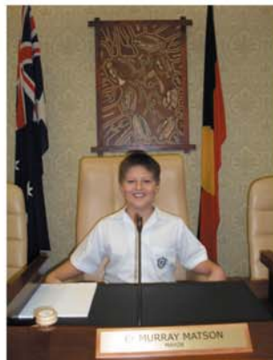
Year 4 debates in Randwick City Council chambers