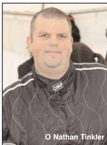
Ο Nathan Tinkler

Ένα 17χρονο αγόρι από το Νιούκαστλ συνελήφθη τα ξημερώματα χθες, σχετικά με την κλοπή πολλών αυτοκινήτων πολυτελείας, συμπεριλαμβανομένης και της Φερράρι αξίας $500,000 του μεγαλοεπιχειρηματία Nathan Tinkler. Εκπρόσωπος της αστυνομίας είπε ότι ο ανήλικος συνελήφθη σε σπίτι της περιοχής Merewether στις 3 τα ξημερώματα χθες. Η μαύρη Φερράρι του κ. Tinkler κλάπηκε από την έπαυλή του στο Merewether τον προηγούμενο μήνα και τελικά βρέθηκε καμένη κοντά στον αυτοκινητόδρομο Πασίφικ.