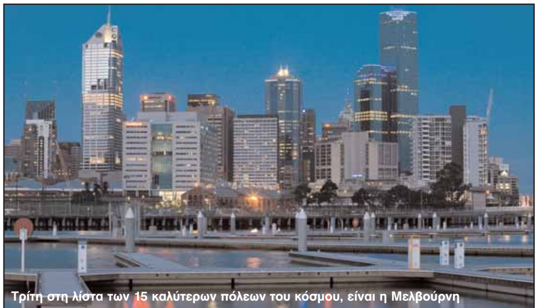
Τρίτη στη λίστα των 15 καλύτερων πόλεων του κόσμου, είναι η Μελβούρνη