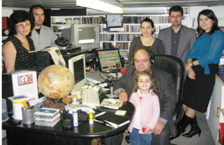
Δημοσιογράφοι που έχετε θαυμάσει στην τηλεόραση, αλλά και άλλοι που βρίσκονται μόνο στο ραδιόφωνο, παρελαύνουν από το σταθμό μας, με τις εκπομπές τους, φέρνοντας κοντά μας την Ελλάδα

ΣΥΝΤΟΝΙΣΤΕΙΤΕ με τον ραδιοφωνικό σταθμό ΡΑΔΙΟ - ΓΕΦΥΡΑ στη συχνότητα των 152.325 χιλιοκύκλων. Επικοινωνούμε μαζί σας, με φαντασία συναίσθημα, ποιότητα, γνώση και λογική. Ο σταθμός μας έχει καταστεί ένα ενημερωτικό και ψυχαγωγικό βήμα που διακρίνεται από συνέπεια, αξιοπιστία, πληρότητα, υπευθυνότητα και σύνεση. "ΡΑΔΙΟ - ΓΕΦΥΡΑ" ΓΕΦΥΡΑ με την πατρίδα και όλο τον κόσμο. ΓΕΦΥΡΑ με την παράδοση, τα ήθη και τα έθιμα. ΓΕΦΥΡΑ με την ιστορία, παλαιά και σύγχρονη. ΓΕΦΥΡΑ με το παρελθόν το παρόν και το μέλλον. ΓΕΦΥΡΑ με τις ανθρώπινες σχέσεις. "ΡΑΔΙΟ - ΓΕΦΥΡΑ" 24 ώρες το εικοσιτετράωρο, με πολύ καλά προγράμματα ντόπιας παραγωγής, αλλά και από την πατρίδα και όλο τον κόσμο.