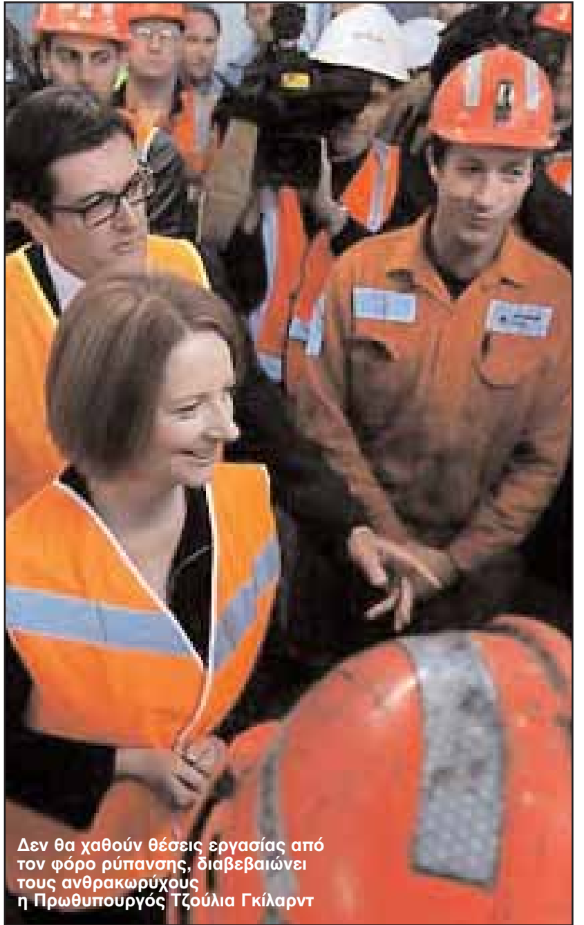
Δεν θα χαθούν θέσεις εργασίας από τον φόρο ρύπανσης, διαβεβαιώνει τους ανθρακωρύχους η Πρωθυπουργός Τζούλια Γκίλαρντ

Αργότερα όμως ο κ. Άμποτ ανακάλεσε την αρχική του δήλωση και τόνισε ότι οι εκπομπές διοξειδίου του άνθρακα μπορούν να μειωθούν με πιο λογικούς τρόπους, όπως με την εμφύτευση περισσότερων δέντρων και με την μείωση κατανάλωσης ενέργειας. Στο μεταξύ, ο Σύνδεσμος Γεωργοκτηνοτρόφων της Νέας Νότιας Ουαλίας, υποστηρίζει ότι ο φόρος ρύπανσης προσβάλλει τον κοινωνικό και οικονομικό οικοδόμημα της επαρχιώτικης Αυστραλίας, εφόσον θα μειώσει το εισόδημα των γεωργοκτηνοτρόφων κατά 3 - 4%.