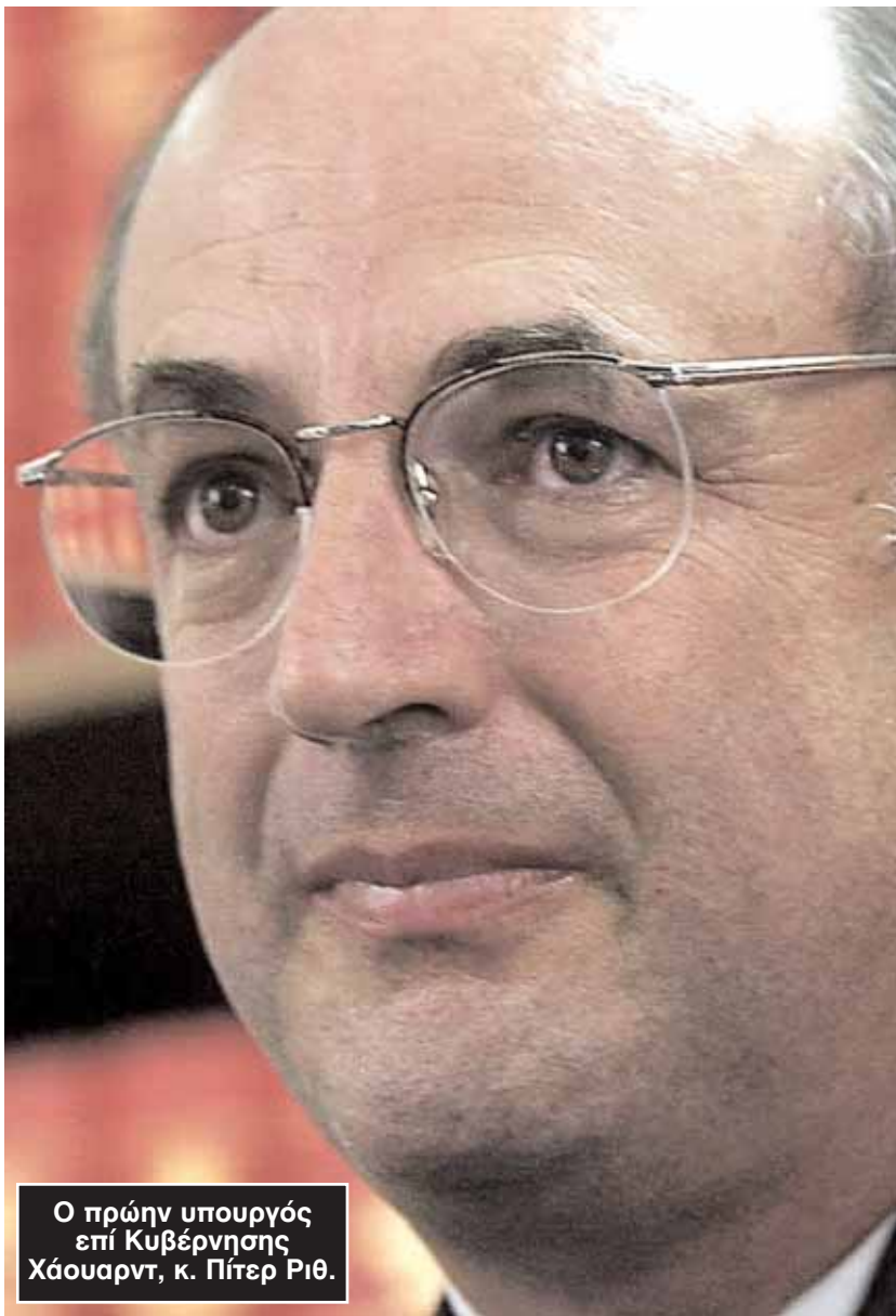
Ο πρώην υπουργός επί Κυβέρνησης Χάουαρντ, κ. Πίτερ Ριθ.