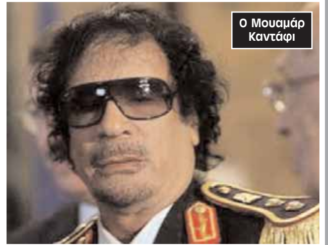
Ο Μουαμάρ Καντάφι

Ο Ραντ εξέδωσε αυτή την ανακοίνωση μετά το πέρας της 4ης συνόδου της Ομάδας Επαφής για τη Λιβύη που πραγματοποιήθηκε στην Κωνσταντινούπολη.