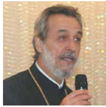
Επίσκοπος Απολλωνιάδος κ. Σεραφεΐμ, ένθερμος υποστηρικτής τής ομόνοιας στην παροικία.