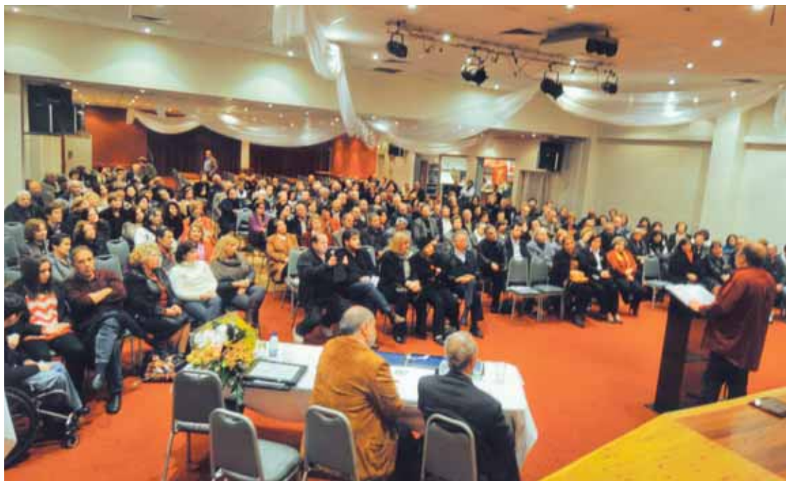
Άποψη του ακροατηρίου

Με την επισημοποίηση της αδελφοποίησης των ραδιοσταθμών 2MM και Real FM, άρχισε την Τετάρτη το βράδυ 29 Ιουνίου 2011, η Βραδιά Ποίησης που παρουσίασε ο πολύ δημοφιλής και κοσμογιάπιτος στην Αυστραλία παραγωγός ραδιοφώνου, Μάνος Τσιλιμίδης («Ο Άγρυνος»), ο οποίος απάγγειλε ποιήματα αγαπημένων του ποιητών, όπως του Γιάννη Ρίτσου, του Ορέστη Λάσκου («Θα πάω στο Παρίσι»), του Ναπολέοντα Λαπαθιώτη («Κλείστε τα παράθυρα»), της Μαρίας Πολυδούρη, Κώστα Καβάφη και άλλων.