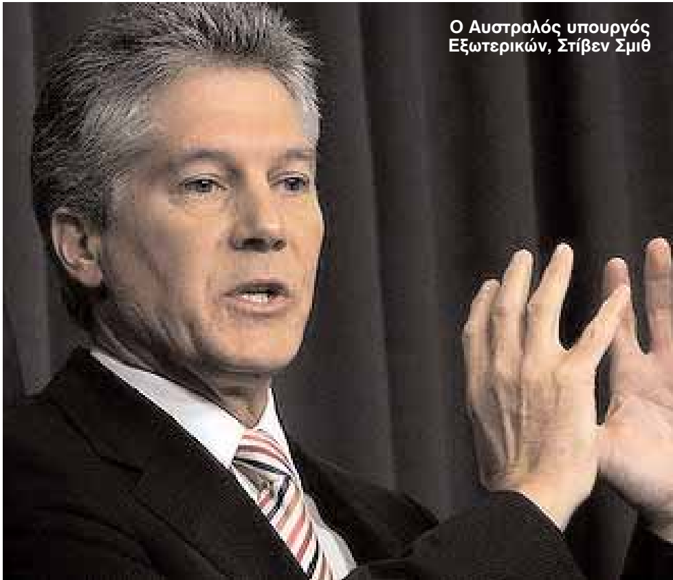
Ο Αυστραλός υπουργός Εξωτερικών, Στίβεν Σμιθ