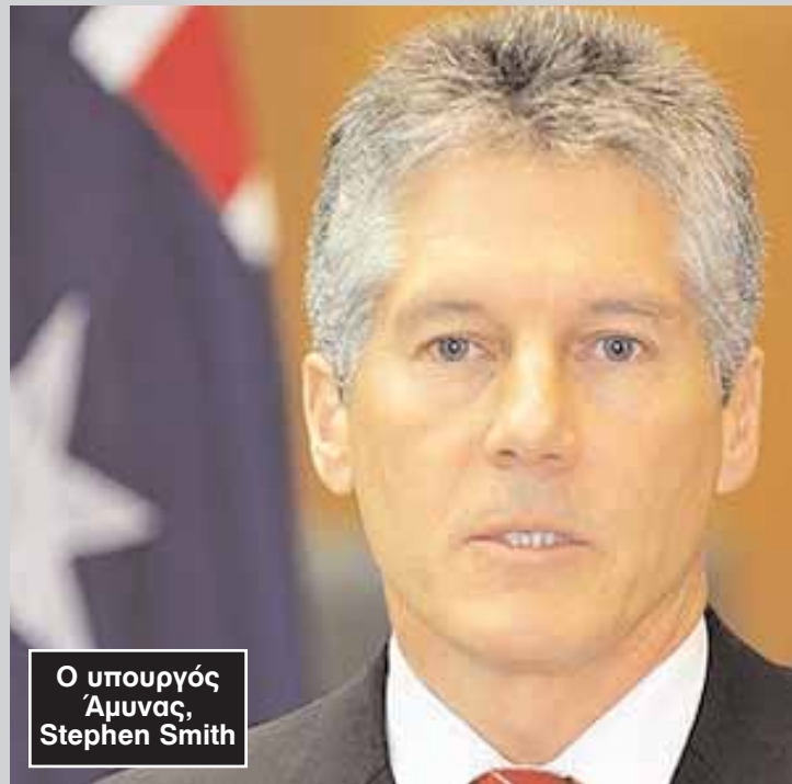
Ο υπουργός Άμυνας, Stephen Smith

Την ίδια ώρα, η αλλαγή του συσχετισμού δύναμης στη ζώνη της Ασίας και του Ειρηνικού ανησυχεί και τις Ηνωμένες Πολιτείες. Η πολιτική και στρατιωτική ηγεσία της μεγάλης συμμαχίας της Αυστραλίας συνεκτιμά ότι η βόρεια Αυστραλία είναι βασικός κρίκος στην αλυσίδα ασφάλειας της Ασίας και του Ειρηνικού, γι' αυτό προτείνει, κατά καιρούς, την αναβάθμιση του ρόλου της πέμπτης ηπείρου στην περιοχή, σε συνεργασία με το αμερικανικό Πεντάγωνο.