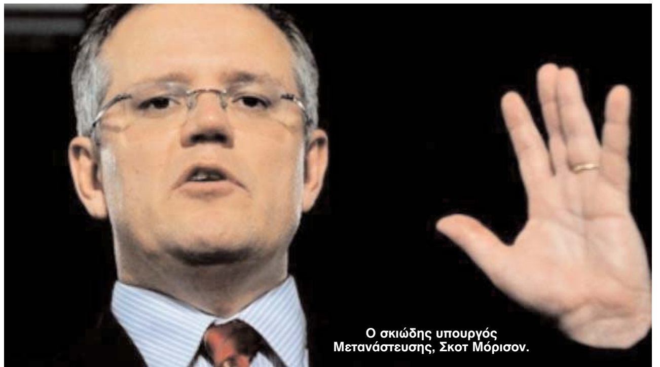
Ο σκιώδης υπουργός Μετανάστευσης, Σκοτ Μόρισον.

«Ο λόγος που πάω στη Μαλαισία είναι για να δω από πρώτο χέρι τις συνθήκες κάτω από τις ο-