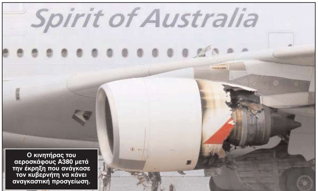
Ο κινητήρας του αεροσκάφους A380 μετά την έκρηξη που ανάγκασε τον κυβερνήτη να κάνει αναγκαστική προσγείωση.

Στη συνέχεια η εταιρεία υποχρεώθηκε - για λόγους ασφαλείας - να καθιλώσει στο έδαφος και τα έξι A380 που διαθέτει.