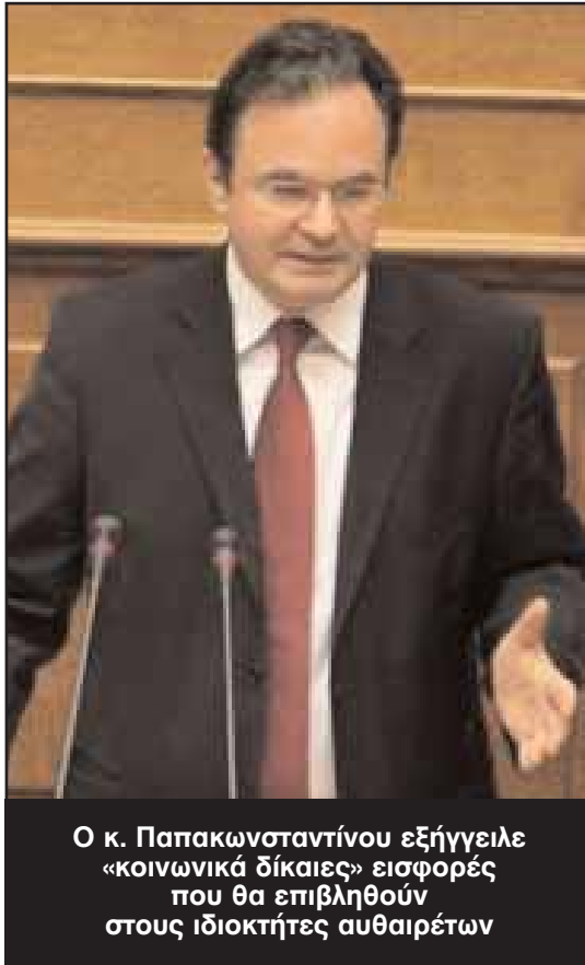
Ο κ. Παπακωνσταντίνου εξήγγειλε «κοινωνικά δίκαιες» εισφορές που θα επιβληθούν στους ιδιοκτήτες αυθαίρετων

Το σύστημα έκδοσης των οικοδομικών αδειών θα αλλάξει ριζικά. Η σύνταξη των μελετών και η εξέλιξη του έργου θα εκτελούνται με ευθύνη του μηχανικού. Η επικοινωνία του μηχανικού και του πολίτη με τις υπηρεσίες θα γίνεται αποκλειστικά ηλεκτρονικά.