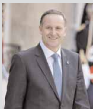
Ο πρωθυπουργός της Ν. Ζηλανδίας, Τζον Κι.

Στην Αυστραλία βρίσκεται από την Κυριακή ο πρωθυπουργός της Νέας Ζηλανδίας, Τζον Κι. Να σημειωθεί ότι λίγο μετά την άφιξή του, ο κ. Κι συναντήθηκε με την Γενική Κυβερνήτρια της Αυστραλίας, Κουέντιν Μπράις, και αργότερα με την πρωθυπουργό Τζούλια Γκίλαρντ για ανεπίσημες συνομιλίες και δείπνο στην πρωθυπουργική κατοικία.