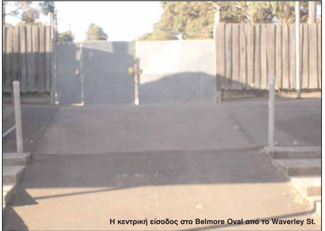
Η κεντρική είσοδος στο Belmore Oval από το Waverley St.

Στο μεταξύ, μετά από την μεγάλη συμμετοχή για την κλήρωση των εισιτηρίων διαρκείας των φετινών αγώνων του Σ. Ολύμπικ στην έδρα του, η διοίκηση του Σ. Ολύμπικ παραχώρησε ευγενικά στην εφημερίδα μας άλλα τρία εισιτήρια διαρκείας για τους φίλους της ομάδας. Έτσι, θα κληρωθούν τελικά 5 τυχεροί φίλοι των "γαλανόλευκων".