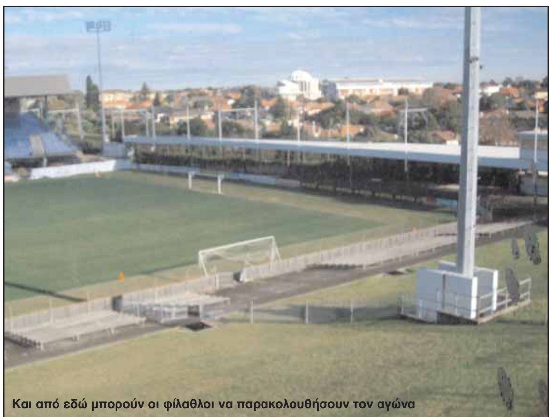
Και από εδώ μπορούν οι φιλάθλοι να παρακολουθήσουν τον αγώνα