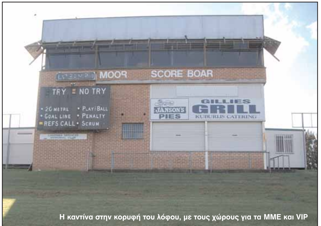
Η καντίνα στην κορυφή του λόφου, με τους χώρους για τα ΜΜΕ και VIP