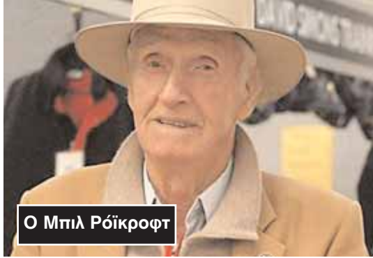
Ο Μπιλ Ρόικροφτ

Την τελευταία του πνοή άφησε σε ηλικία 96 ετών ο διεθνούς φήμης ιππέας Μπιλ Ρόικροφτ, ο οποίος μπήκε στο «πάνθεον» της διεθνούς ιππασίας, τόσο για την πλούσια σε διακρίσεις και μετάλλια καριέρα του, όσο και για την αυταπάρηση που επέδειξε στους Ολυμπιακούς Αγώνες της Ρώμης το 1960. Τι συνέβη όμως στην Ρώμη και έκανε ξεχωριστό τον Ρόικροφτ; «Οι ιππείς μας κατέκτησαν στην Ρώμη το πρώτο χρυσό Ολυμπιακό μετάλλιο στην ιππασία. Όμως το κουράγιο του Μπιλ, έκανε εκείνη την επιτυχία ιστορική. Είχε τραυματισθεί σοβαρά στο «κρος κάντρι» και συγκεκριμένα είχε σπάσει την κλειδα του. Όμως έφυγε με δική του ευθύνη από το νοσοκομείο για να συμμετάσχει στο αγώνισμα των αλμάτων. Και κατάφερε σχεδόν με ένα χέρι να πραγματοποιήσει 12 προσπάθειες»,