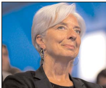
Πολλές μεγάλες ευρωπαϊκές χώρες, όπως η Γερμανία, η Βρετανία και η Ιταλία έχουν ήδη υποστηρίξει την υποψηφιότητα της Λαγκάρντ.

Πολλές μεγάλες ευρωπαϊκές χώρες, όπως η Γερμανία, η Βρετανία και η Ιταλία έχουν ήδη υποστηρίξει την υποψηφιότητα της Λαγκάρντ, ενώ οι αναδυόμενες οικονομίες των χωρών της ομάδας BRICS (Βρετανία, Ρωσία, Ινδία, Κίνα και Νότια Αφρική) κατήγγειλαν επισήμως την πρόθεση της Ευρώπης να διατηρήσει τη θέση.