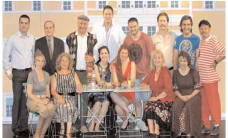
Θρίαμβος Μελβούρνη και Αδελαΐδα. Γέλια μέχρι δακρύων.