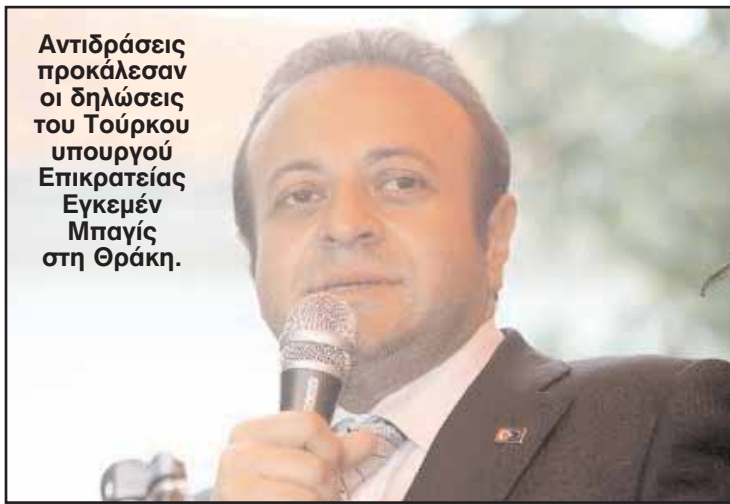
Αντιδράσεις προκάλεσαν οι δηλώσεις του Τούρκου υπουργού Επικρατείας Εγκεμέν Μπαγίς στη Θράκη.

Στην ομιλία του στην Κομοτηνή το βράδυ της Κυριακής, ο Ε. Μπαγίς, επικεφαλής των διαπραγματεύσεων της Τουρκίας με την Ε.Ε, απευθυνόμενος στα μέλη της μειονότητας φέρει να είχε πει ότι «ο Τούρκος γεννιέται Τούρκος και πεθαίνει Τούρκος και ο Ρωμικός, γεννιέται και πεθαίνει Ρωμικός», ενώ υποστήριξε ότι οι πρωθυπουργοί των δύο χωρών συνεργάζονται στενά για την ευημερία των εκατέρωθεν μειονοτήτων, επαναφέροντας δημοσίως το πάγιο επιχείρημα της Άγκυρας περί «αμοιβαιότητας» στον σεβασμό των δικαιωμάτων των μειονοτήτων. Οι δηλώσεις προκάλεσαν διάβημα της Αθήνας και ο Τούρκος πρεσβευτής στην Αθήνα Χασάν Γκογίς κλήθηκε στο υπουργείο Εξωτερικών να δώσει εξηγήσεις. Προκάλεσαν, όμως, και πόλεμο δηλώσεων ανάμεσα στον