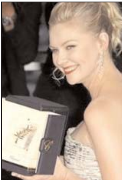
Η Κίρστεν Ντανστ με το βραβείο καλύτερης ηθοποιού για το ρόλο της στην ταινία «Melancholia» του Λαρς Φον Τρίερ

Ο Γάλλος ηθοποιός Ζαν Ντιζαρντέν τιμήθηκε για τη συμμετοχή του στην ασπρόμαυρη και βουβή ταινία The artist του Μισέλ Χαζανβίσιους.