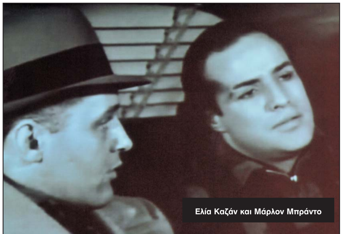
Ελία Καζάν και Μάρλον Μπράντο