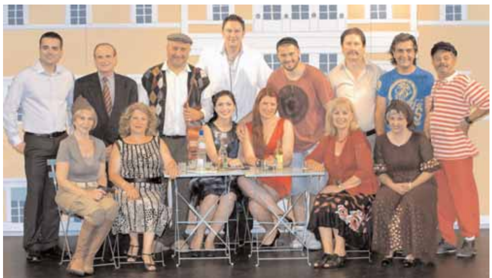
Θριάμβος Μελβούρνη και Αδελαΐδα. Γέλια μέχρι δακρύων.

Παρασκευή: 3 Ιουνίου βραδινή 7.30μμ Σάββατο: 4 Ιουνίου απογευματινή 4.00μμ, βραδινή 7.30μμ Κυριακή: 5 Ιουνίου απογευματινή 2.00μμ, βραδινή 4.30μμ