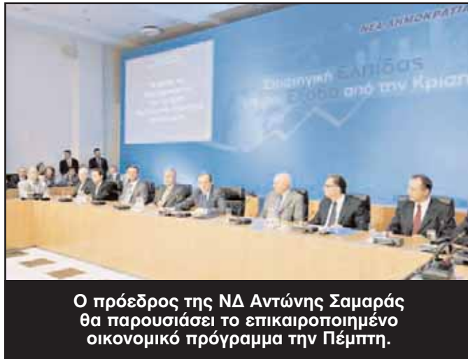
Ο πρόεδρος της ΝΔ Αντώνης Σαμαράς θα παρουσιάσει το επικαιροποιημένο οικονομικό πρόγραμμα την Πέμπτη.

Τη σύσταση εξεταστικής επιτροπής που θα διερευνήσει πως ο Γιώργος Παπανδρέου οδήγησε τη χώρα στα δεσμά του μνημονίου φαίνεται ότι προσανατολίζεται να προτείνει ο πρόεδρος της Ν.Δ., Αντ. Σαμαράς, κατά την παρουσίαση του ανανεωμένου οικονομικού προγράμματος του κόμματός του, γνωστού και ως «Ζάππειο II», την Πέμπτη 12 Μαΐου. Μετά και τις αποκαλύψεις των δηλώσεων του Στρος Καν, ο Αντώνης Σαμαράς στο Ζάππειο θα επικεντρώσει τα πυρά του στον ίδιο τον Γιώργο Παπανδρέου.